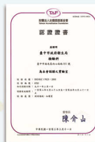
財團法人全國認證基金會認證

檢驗報告的正確性十分重要，除了會影響食品是否合乎衛生法規標準，進一步還會關係到行政裁罰(被檢驗到生產不合法規食品的廠商是會受罰的)。有鑑於此，本局實驗室對於檢驗報告的品質特別重視，檢驗的流程均依照實驗室管理規範ISO/IEC17025之規定，並通過國內兩大實驗室認證系統-財團法人全國認證基金會(Taiwan Accreditation Foundation, TAF)以及衛生福利部食品藥物管理署之認證，每年均有稽核委員於實驗室進行實地稽核，確保執行食品檢驗與出具檢驗報告之品質與正確。