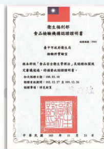
衛生福利部食品藥物管理署認證