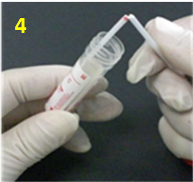
4. 將拭子 90 度折斷後，將上半部拭子丟棄