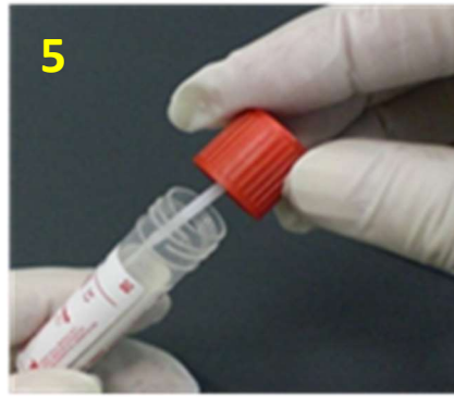
5. 蓋上紅色上蓋，使拭子軸壓入管中，順時針方向旋緊