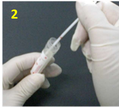
2. 將已採樣的拭子插入傳送管中