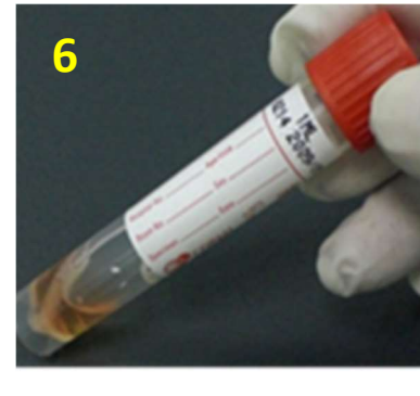
6. 側邊標籤標示受檢者資訊後，放入檢體傳送袋，盡速送達實驗室