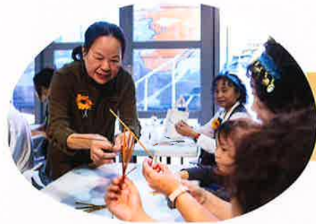
技藝傳承 講座分享