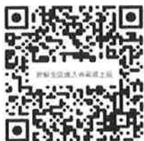
社會局 達人典藏線上展