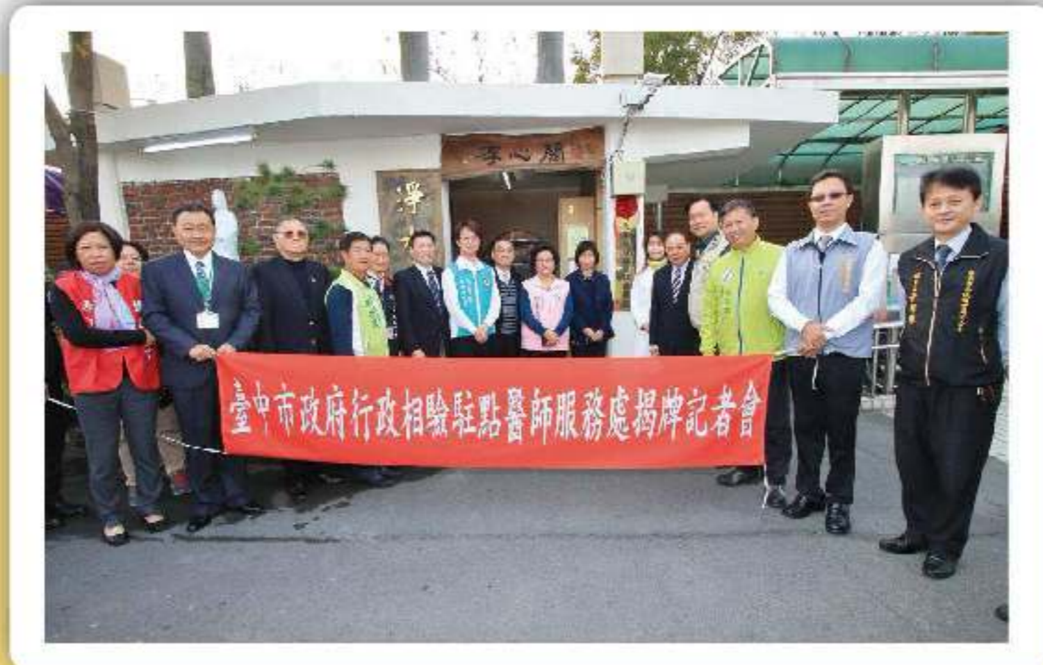
行政相驗駐點醫師服務處

為提供以人為本的關懷式行政相驗服務，本局統計本市各行政區相驗量，發現北區相驗量佔本市全年相驗量近25%，為使民衆面對至親離開時，不再為辦理相驗事宜舟車勞頓、身心俱疲，本局於北區生命禮儀管理處崇德殯儀館內，設置「行政相驗駐點醫師服務處」，提供更多「有溫度」、「有協助」、「有感動」的服務，快速服務市民，讓民衆順利辦理身後事。