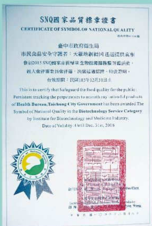
SNQ國家品質標章證書

SNQ為Symbol of National Quality的縮寫，該標章由國家生技醫療產業策進會集合國內120位包括食品、藥品、製藥、生技、醫療、護理等橫跨產官學界共同組成之評審團，針對審查項目不同，找到該領域頂尖之專家，通過書審、簡報、甚至實地勘查階段，決定是否通過認證標章。