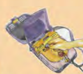
插上導線連接電擊器