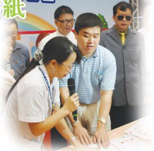
藥師協助將點字圖形貼紙貼於藥袋上，方便有需求民衆辨識，避免錯誤用藥！

為解決長輩平日服藥容易發生的問題，例如：吃藥時間搞不清楚、吃錯藥、重複吃藥等，今年特別結合盲人福利協進會推出「藥袋點字圖形貼紙」，由專業藥師貼心為長輩、盲人等族群於藥袋上黏貼，除降低錯誤用藥的頻率，更維護市民的用藥安全。