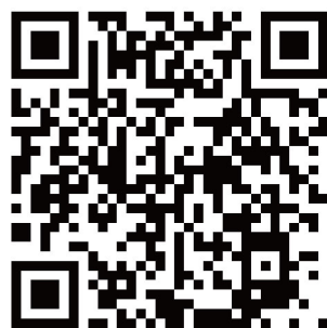
衛生福利部社會及家庭署 發展遲緩兒童通報暨 個案管理服務網