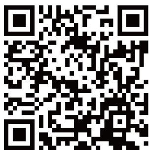
本市 兒童發展評估醫院

當孩童檢核出疑似發展遲緩, 相關人員將通報至衛生福利部社會及家庭署, 本市兒童發展社區資源中心將有專人提供您諮詢服務, 並協助轉介您早期療育相關資源。